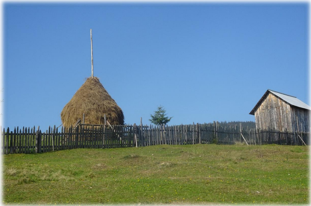
In deze streek, en vermoedelijk in het gehele land, treft men nog regelmatig hooimijten aan.